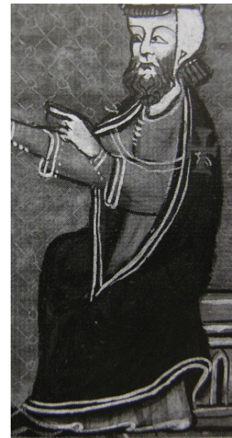
Jacques d'Ollers, sergent du Temple (détail) XIIIème siècle Archives départementales des Pyrénées Orientales (Ms 1 B 33)