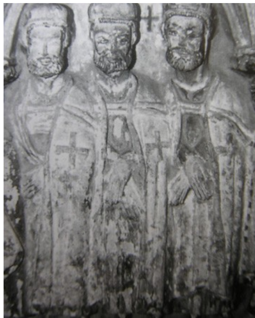
Templiers Tombeau de l'infant Don Felipe (+ 1274) – église Santa Maria de la Blanca – commanderie templière de Villasirpa (détail)