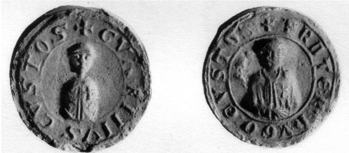
sceau de Garin de Montaigu Grand-Maître de 1207 à 1228