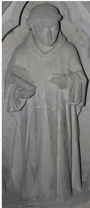
Détail du tombeau de Philippe de France (+ 1235) Basilique de Saint Denis