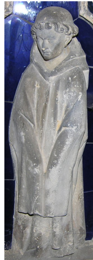
Détail du tombeau de Louis de France (+ 1260) Basilique de Saint Denis