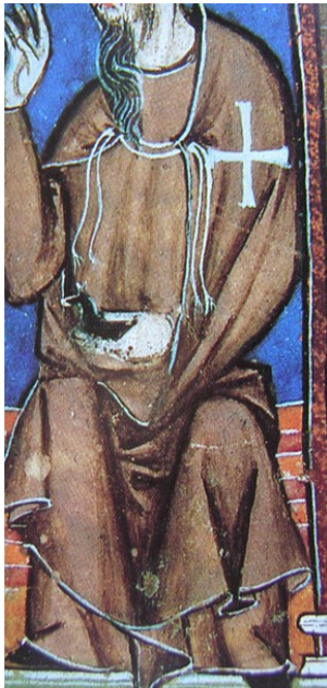
Moine Hospitalier Livre des jeux du roi Alphonse X de Castille (XIIIème siècle) Madrid Bibliothèque du monastère Saint Laurent de l'Escorial (détail)

Des modèles de manteaux nous sont donnés soit par les sceaux des Grands-Maîtres (voir dans la suite du document), soit par quelques sources iconographiques (à partir du XIIIème siècle), chez les Hospitaliers ou les Templiers. Il s'agit d'un vêtement ample, sans capuche, simplement fermé par un double lien (noter sur les illustrations ci-dessous, l'absence de croix sur le vêtement porté sous le manteau, aussi bien pour les Hospitaliers que pour les Templiers).