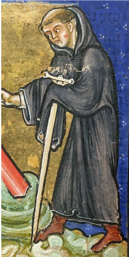
Bede, Prose Life of St Cuthbert Historia Ecclesiastica (fin XIIème siècle)