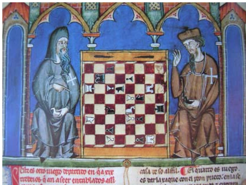
Livre des jeux du roi Alphonse X de Castille (XII ème siècle) Madrid Bibliothèque du monastère Saint Laurent de l'Escorial

J'ai choisi les formes simples du jeu d'origine arabe, en m'aidant du jeu exposé au musée de Noyon (Oise) du XII e siècle pour les dimensions des différentes pièces.