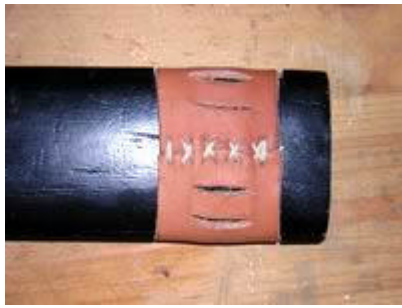
Couture en X à deux aiguilles