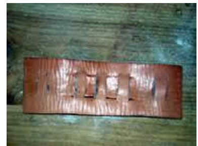
Bande de cuir

On aménage des lumières sur la bande de cuir pur y glisser la languette (2cm). Prévoir trois passants sur le devant du fourreau et deux derrières. La bande est cousue mouillée pour être bien tendue/étirée à la couture. Bien étirer/mouiller les passants pour y glisser la languette.