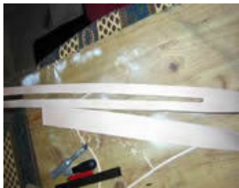
Aménagement des languettes

Sur le fourreau aménager deux rainure pour y loger la bande de cuir sur laquelle la languette sera fixée.