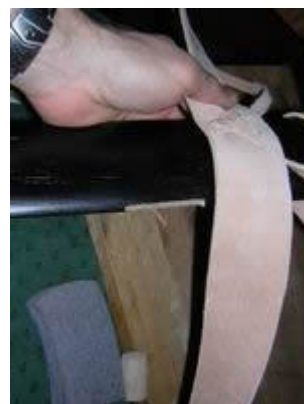
Détail du montage du croisement et de la deuxième 1/2 ceinture