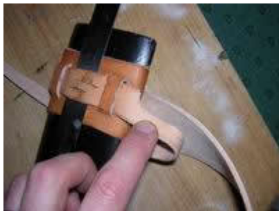
Les deux fentes et la réduction de la languette.

Il convient d'aménager deux fentes longitudinales dans la languette sur la face arrière du fourreau. La languette qui sera réduite de 2cm à 1cm. Bien mouiller et étirer au montage.