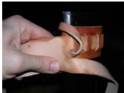
La languette réduite est repliée sur l'arrière...