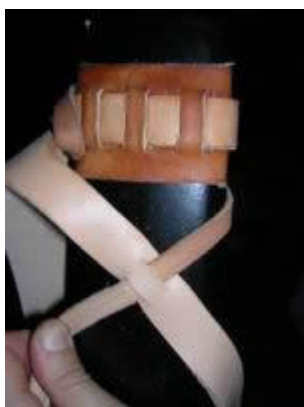
Croisement sur l'avant