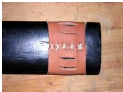
Croisement sur l'arrière